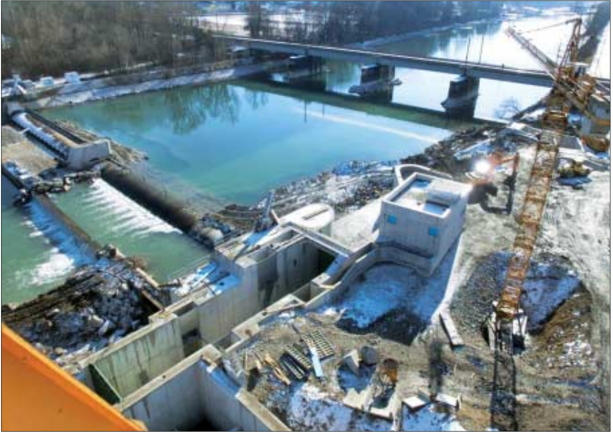
Kraftwerk Enns – Aus- und Umbauarbeiten im Zuge der NGP-Maßnahmen