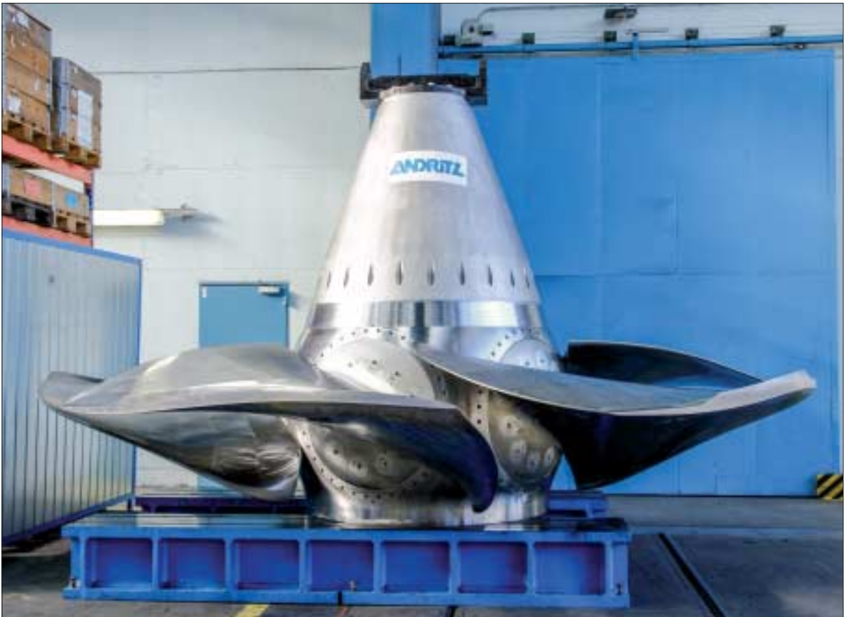
Kraftwerk Ternberg – neues Laufrad bei Abnahme im Herstellerwerk